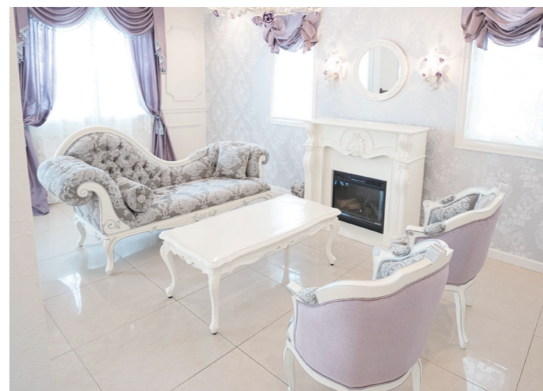
▲新しい拠点では、ハープをこよなく愛したマリー・アントワネットのプチトリアノンの調度品を再現した。気品と静謐さが漂うスペースだ。

特注品のサルヴィハープ、 ミネルヴァ・ホワイトを弾く。 イメージは、自身の奏法と マッチしたペガサスだ。