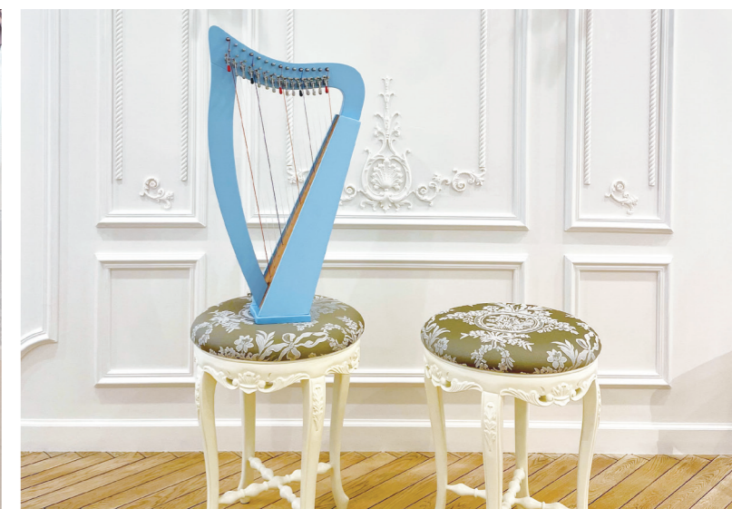
▲「入門には最適」と、ご本人も太鼓判を押す、銀座十字屋オリジナルの15弦ハープ「クリスハープ」。まもなく、クリスハープの教室もスタートするという。